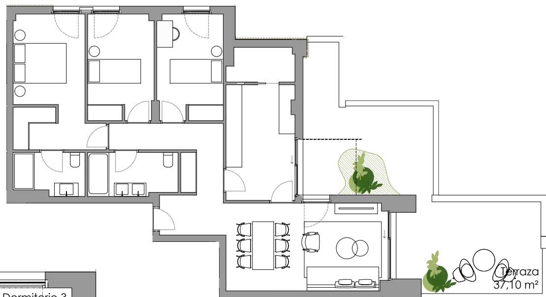
PLANTA DE VIVIENDA