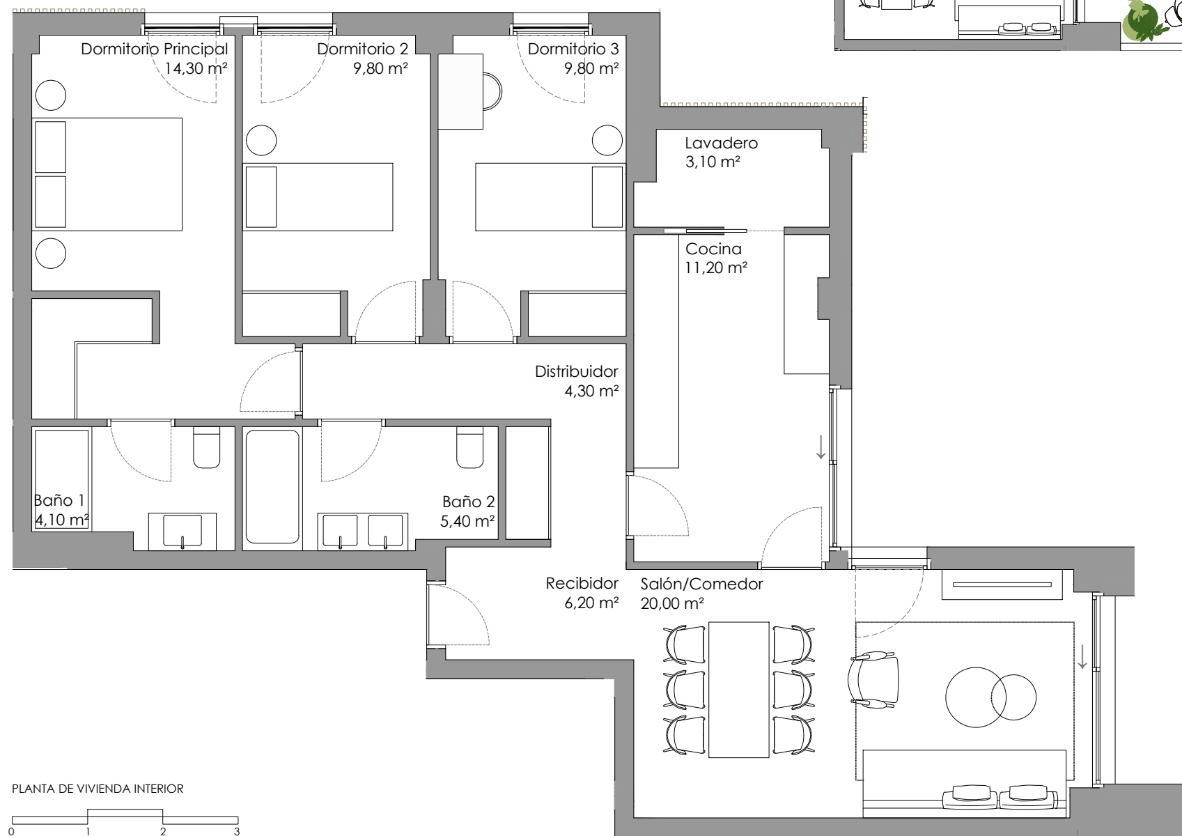
PLANTA DE VIVIENDA INTERIOR